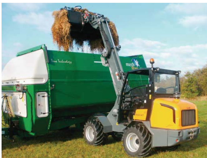
Giant V6004T Tele bei der Ladewagenbefüllung