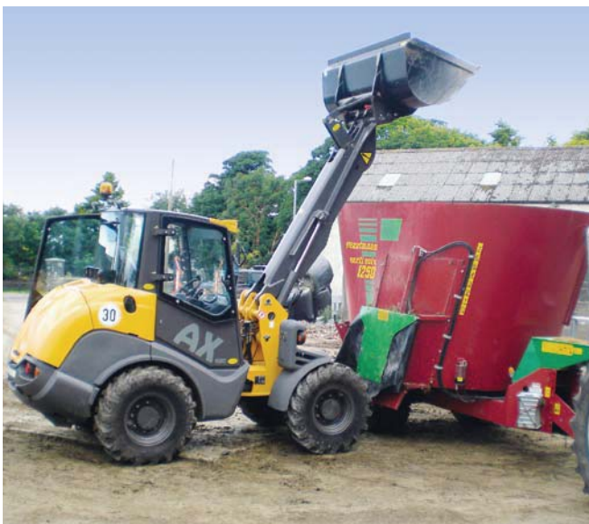
Mecalac AX 1000 als Highlift-Version