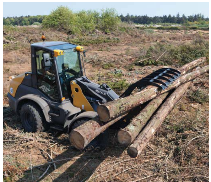
Mecalac AF 1200 mit Holzlange