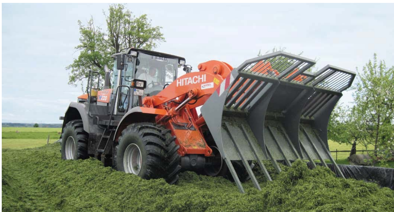
Hitachi ZW220 bei der Grassilage