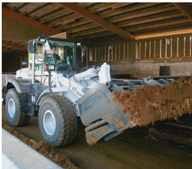
Hitachi ZW150 bei der Stallarbeit