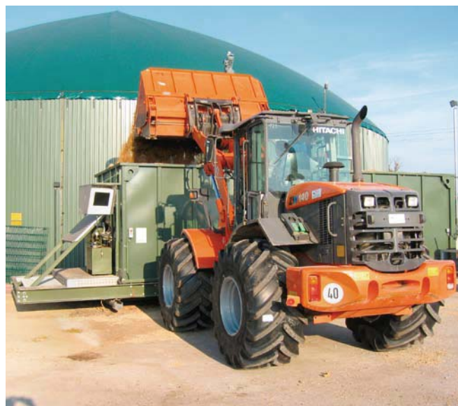
Hitachi ZW140 bei der Biogasanlagenbefüllung