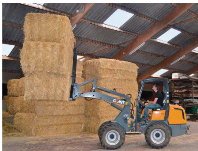
Giant V452T HD bei der Quaderballenlagerung