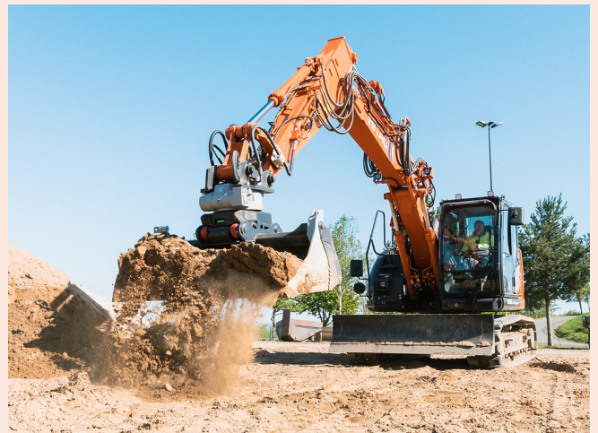
Mit KTEG OQR: Der Bagger wird zum Radlader