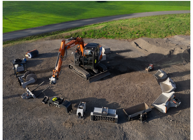
Für jede Anwendung das passende Anbaugerät in 10 s angebaut und sofort einsatzbereit