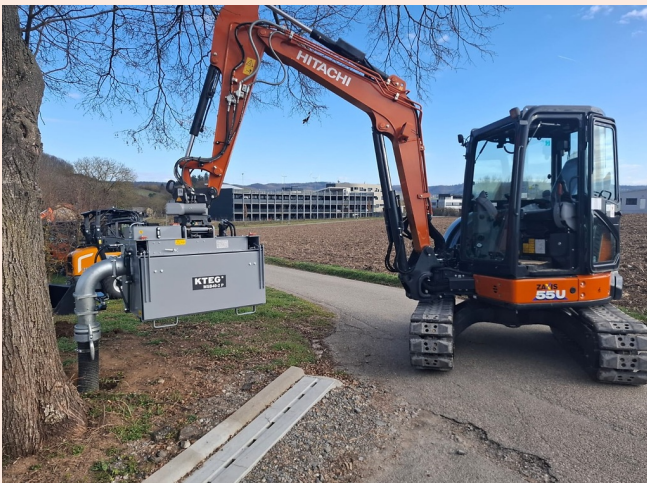
Mit KTEG OQR: Kein Drehwerk an Anbaugeräten erforderlich, reduzierte Aufbauhöhe und Gewicht