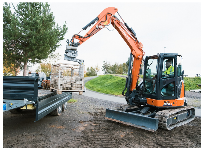
Mit KTEG OQR: Der Bagger wird zum Geländestapler