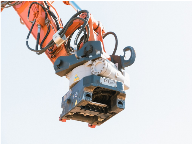
Vollhydraulischer Schnellwechsler mit Rotation mit integrierte Hydraulik-Durchführung, alle Anbaugeräte 360° endlos drehbar