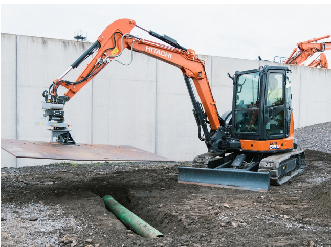
Mit KTEG OQR: Baustellenmechanisierung und Prozessoptimierung auf der Baustelle, ohne Handarbeit