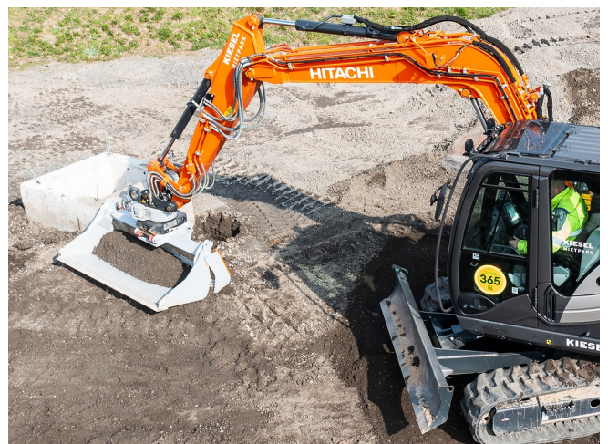
Offset Funktion: Laden, Greifen und Planieren außerhalb der Fahrriichtung