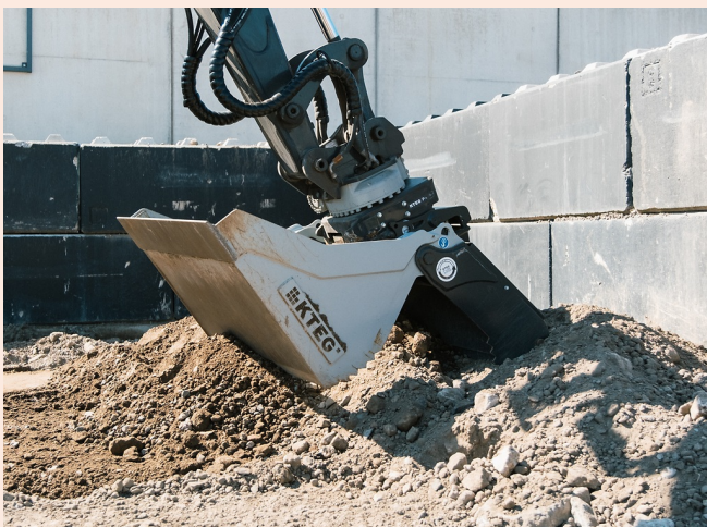
Klappfunktion zum Aufnehmen und Greifen von Material