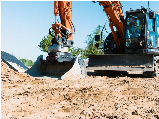
Laden wie ein Radlader