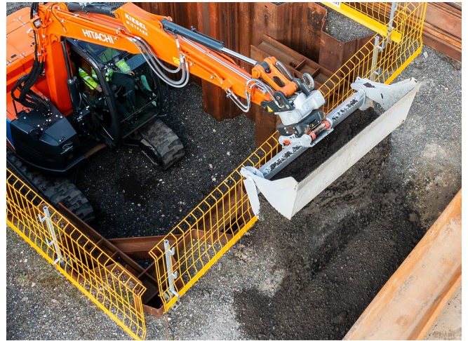
Erheblich größere Überladehöhe