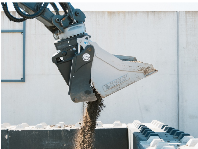
Exaktes Entleeren und sauberes Verfüllen