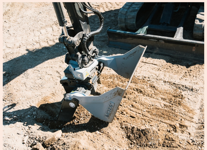
Integriertes Planiermesser zum Schieben und Planieren