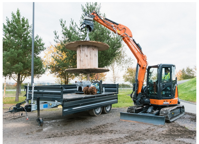
Ein Arbeitsgang: Aufnehmen, Positionieren und Verlegen