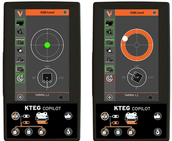
OQR Level - integrierte Wasserwaage