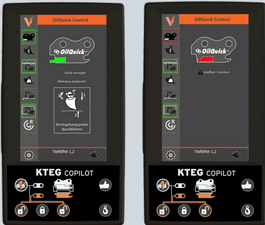
Doppelt abgesicherte Verriegelungskontrolle