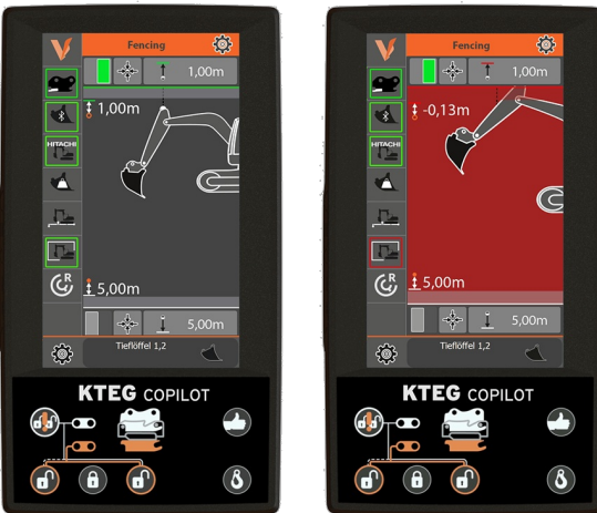
Passive Höhen- und Tiefenbegrenzung