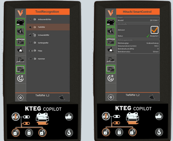
Automatische Werkzeugerkennung und -einstellung