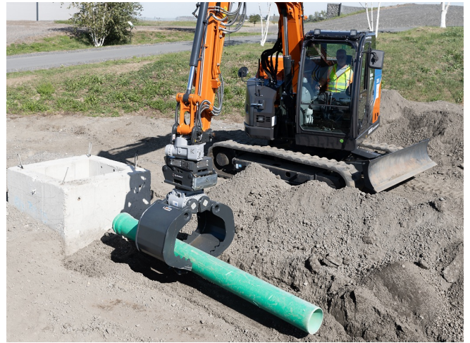
Kontrolliertes Aufnehmen und Positionieren von Rohren direkt im Graben