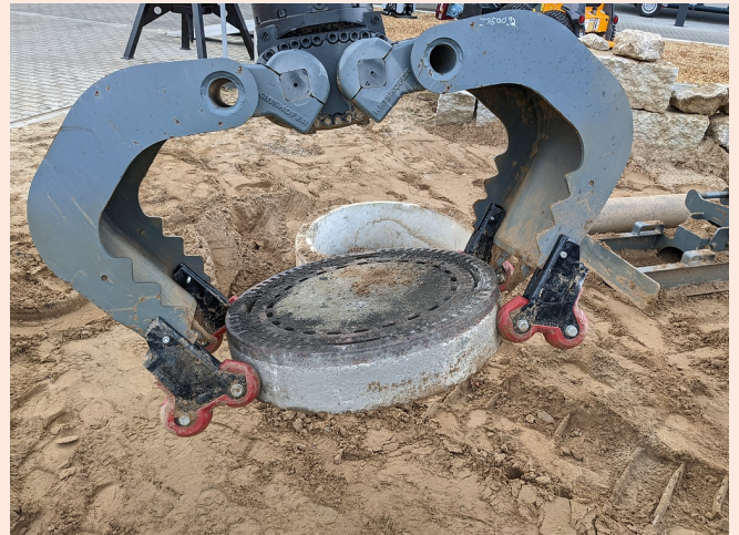
4-Grip Ansteckvorrichtung: Beschädigungsfreies Greifen von Betonteilen und Bordsteinen