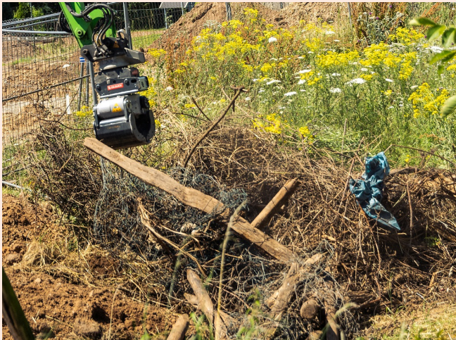
Greifen und Entfernen von Holz und Fremdmaterial aus sensiblen Bereichen