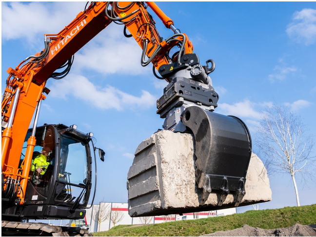
Präzises und sicheres Greifen von schweren Betonteilen