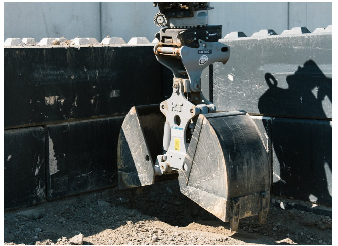
Graben im randnahen Bereich direkt an der Wand