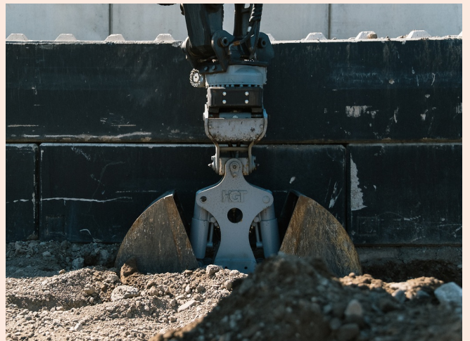
Graben in Bereichen, wo Tieflöffel nicht arbeiten können