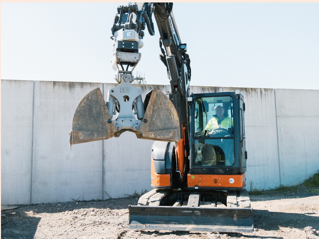
Besonders effektiv im Einsatz mit Minibaggern: Mind. 50% weniger Handschachtung