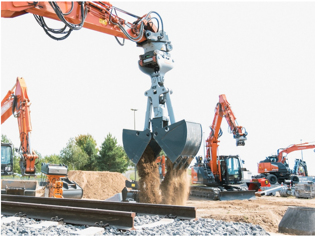
Maximale Reichweite und Flexibilität: Graben über Hindernisse hinweg