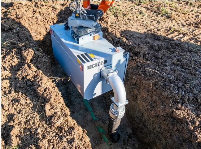
Kompakte, schmale Bauform für Anwendungen im Graben