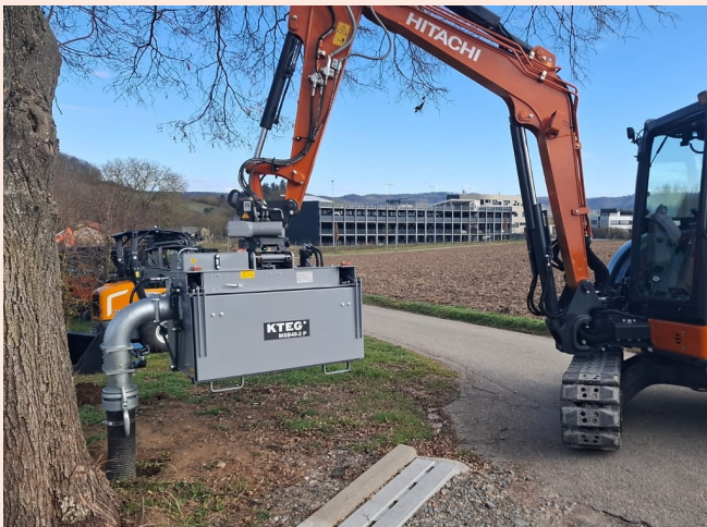
Absaugen von Erde an Baumwurzeln