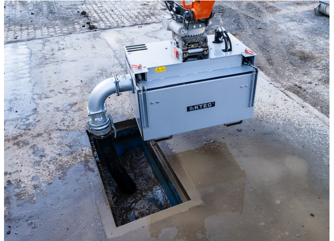
Saugen von Flüssigkeiten und Schlamm