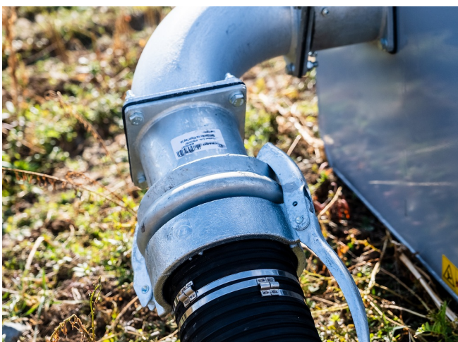
Schnellverschluss für einfachen Wechsel unterschiedlicher Saugschläuche auf der Baustelle