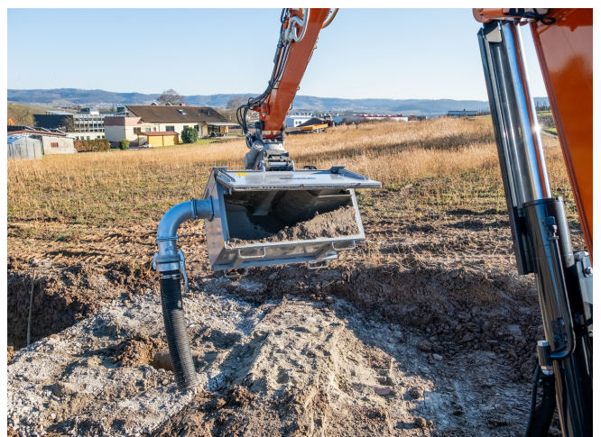
Hydraulische Klappe für Entleerung