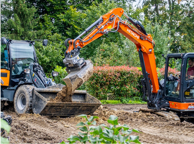
Hochlöffelmodus: Kontrollierte Materialaufnahme und -führung auch in erhöhter Löffelstellung