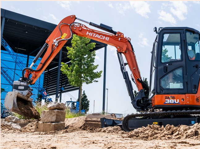
Präzises Arbeiten entlang von Kanten und Bauwerken durch seitlich gedrehten Profillöffel