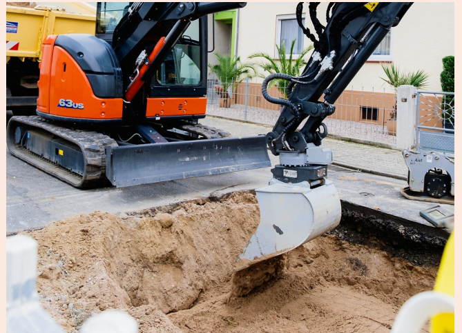
Sauberes Planieren und Rückverfüllen im Graben