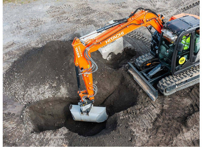
Saubere Profilierung von Gräben und Mulden dank optimaler Löffelform und Rotationsfunktion