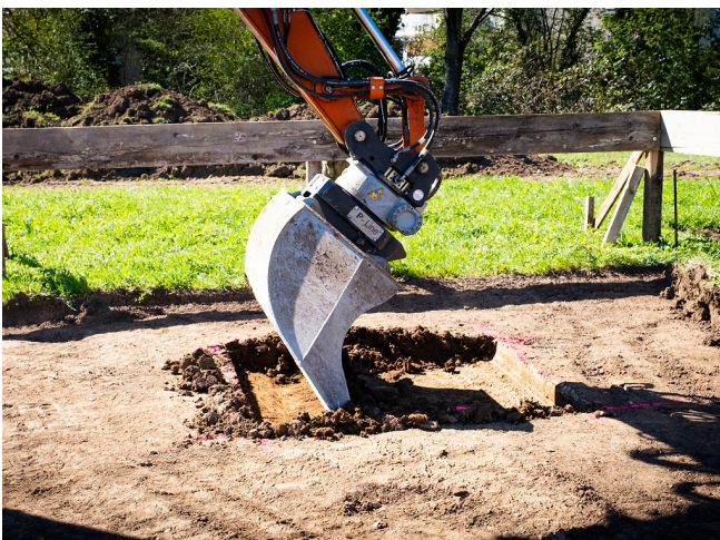
Feinfühliges Abziehen und Nacharbeiten für ein gleichmäßiges Flächenprofil