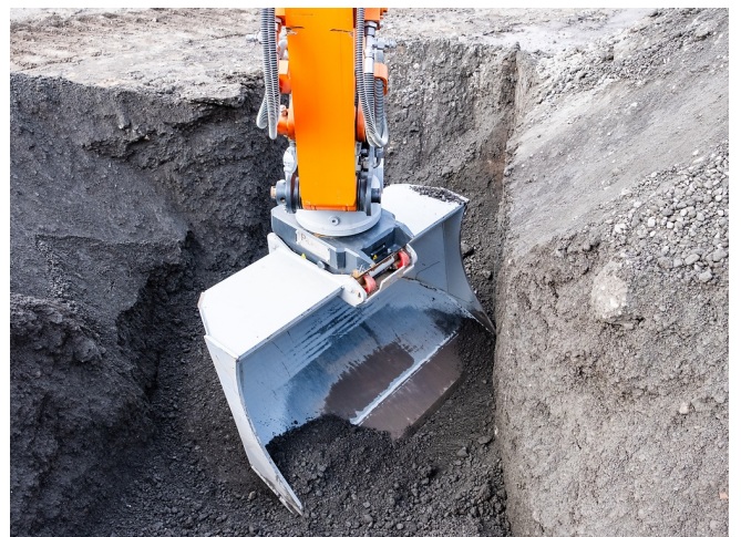
Schräge Löffelseite für sauberes und präzises Arbeiten im Graben