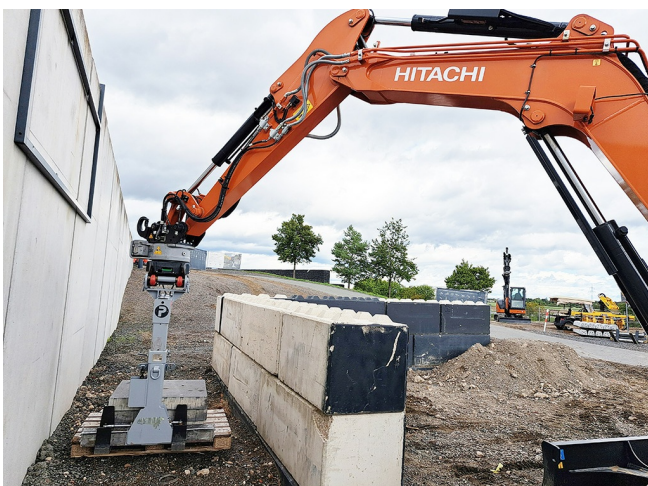
Sicheres Versetzen von Lasten - auch über Hindernisse hinweg