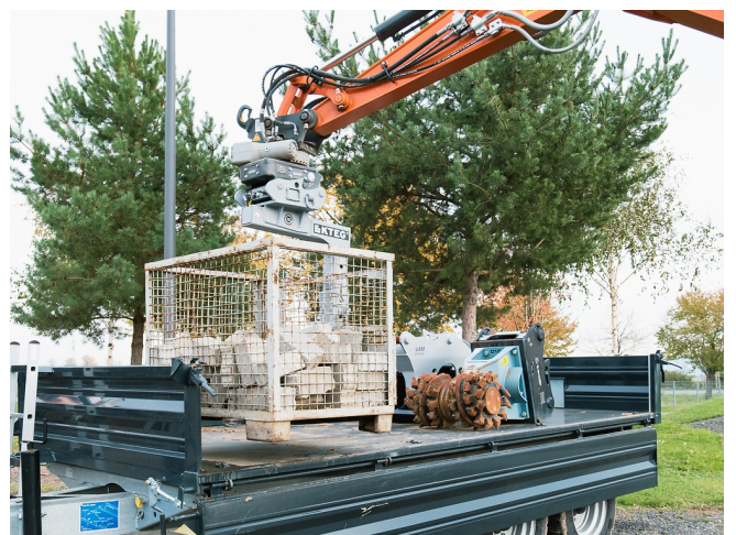
Zentraler Lastschwerpunkt für maximales Hubvermögen