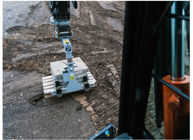
Perfekte Sicht von der Kabine aus