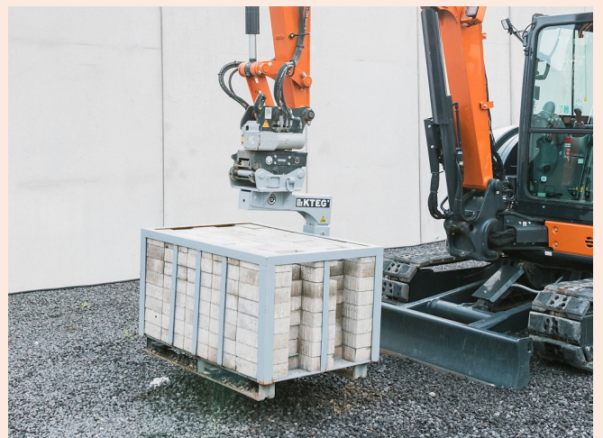
Automatischer 0°-Niveauegleich mit KTEG Zero Level Automatic System