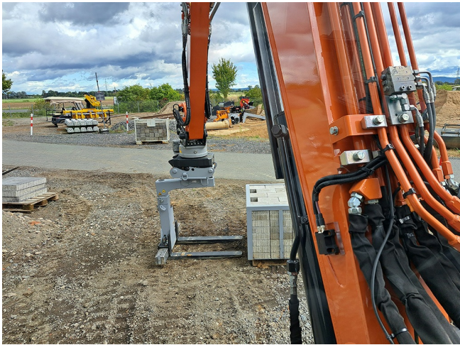
Flexible Lastaufnahme - auch seitlich