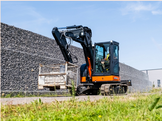
Paletten umsetzen und verfahren wie mit einem Radlader