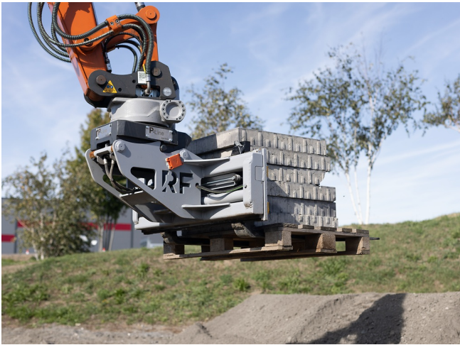
Flexibles Aufnehmen verschiedenster Paletten durch hydraulisch verstellbare Zinken