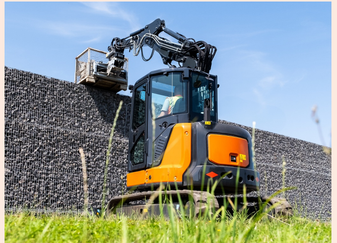
Aufnehmen und Absetzen von Paletten über Hindernisse dank hoher Überladehöhe und 360°-Rotation