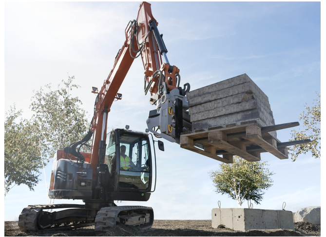
Kontrolliertes Palettenhandling mit 360°-Rotation