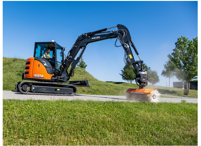
Schnelle Flächenreinigung - bis zu 10x schneller als von Hand