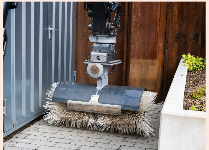
Präzises Kehren bis an Kanten - ohne seitlichen Überhang