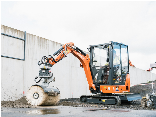
Saubere Reinigung entlang von Mauern und Kanten