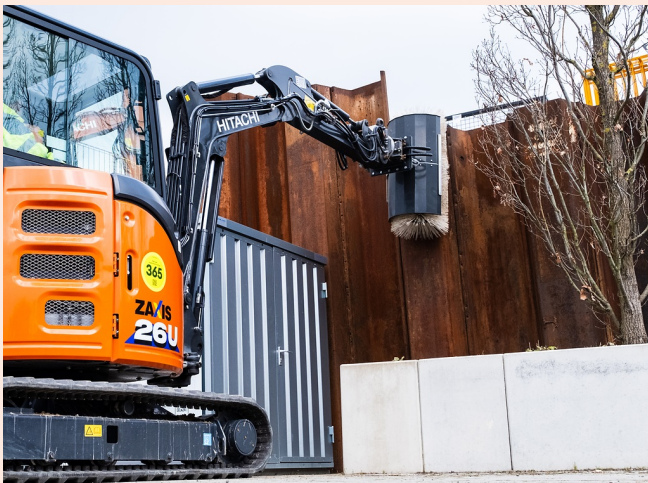
Reinigung schwer zugänglicher und erhöhter Bereiche