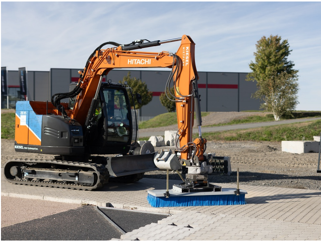
Gründliche Reinigung von befestigten Flächen und Randbereichen