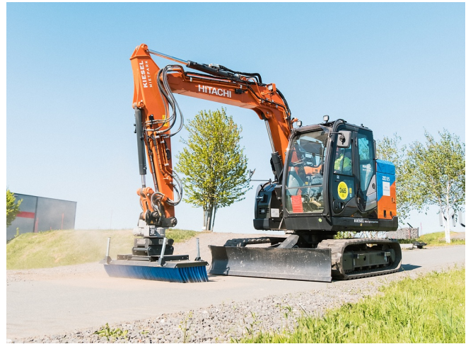
Schnelles Kehren von Wegen und Verkehrsflächen