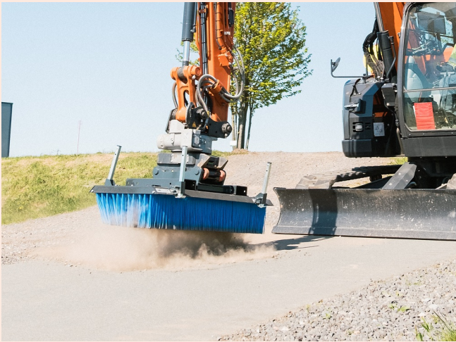
Reinigung schwer zugänglicher Bereiche dank 360°-Rotation