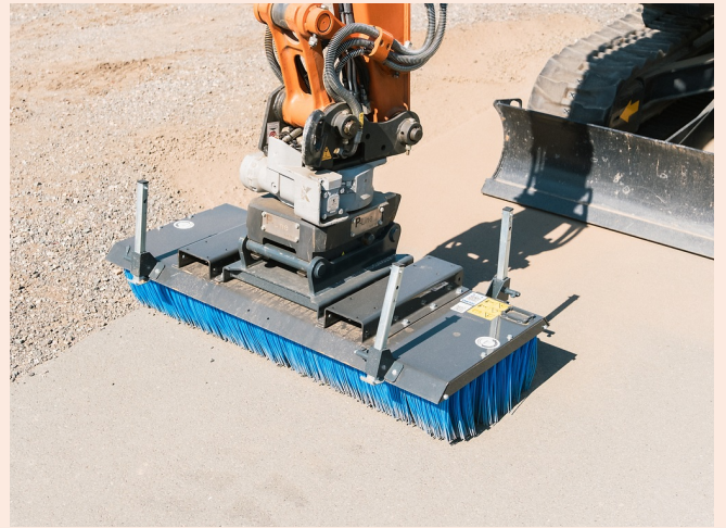
Präzises Kehren bis an Kanten mit mehreren Bürstenreihen