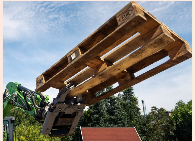
Schonendes Greifen und Umsetzen von sperrigen Objekten