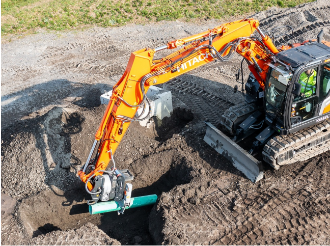
Feinfühliges Greifen und Positionieren von Rohren direkt im Graben