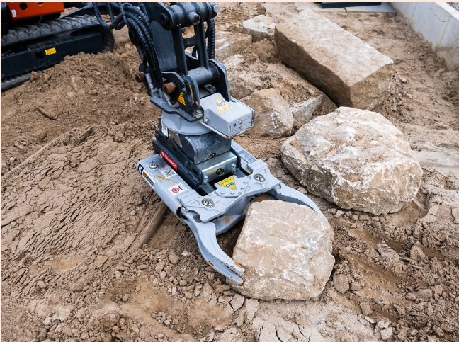
Sicheres und kontrolliertes Platzieren von Steinen