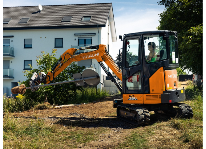
Präzises Greifen von Gegenständen mit schmalen Durchmesser