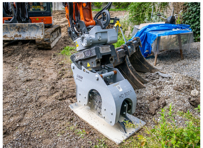
Vollintegrierter OQR Adapter mit innenliegender Hydraulik, keine überstehenden Schläuche