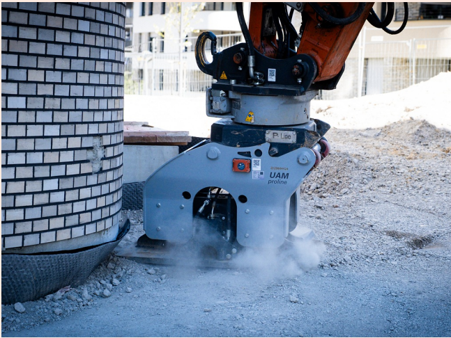
Einseitig gerade Grundplatte: Lückenlose Rand-Verdichtung