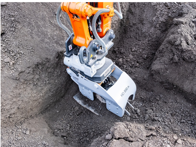
360° Grabenverdichtung auch in Abzweigungen und Hausanschlüssen