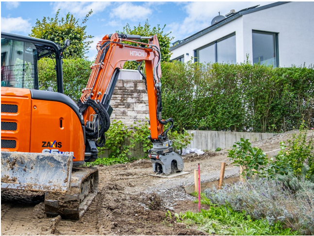
Sichere Verdichtung bei abschüssigen Böden sowie Böschungen