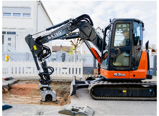
Optimale Stabilisierung mit bestmöglicher Tragfähigkeit des Bodens