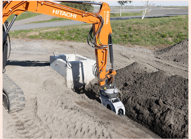
Gezielte Verdichtung im Leitungs- und Rohrgraben