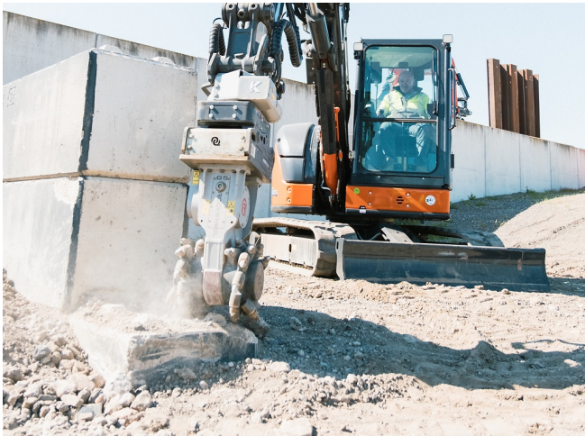
Präziser Fräseinsatz entlang von Bauelementen