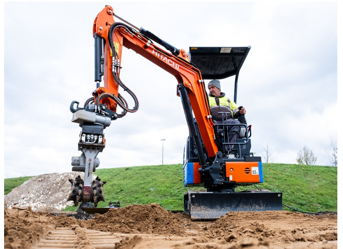
Effektives Fräsen in festen Bodenverhältnissen