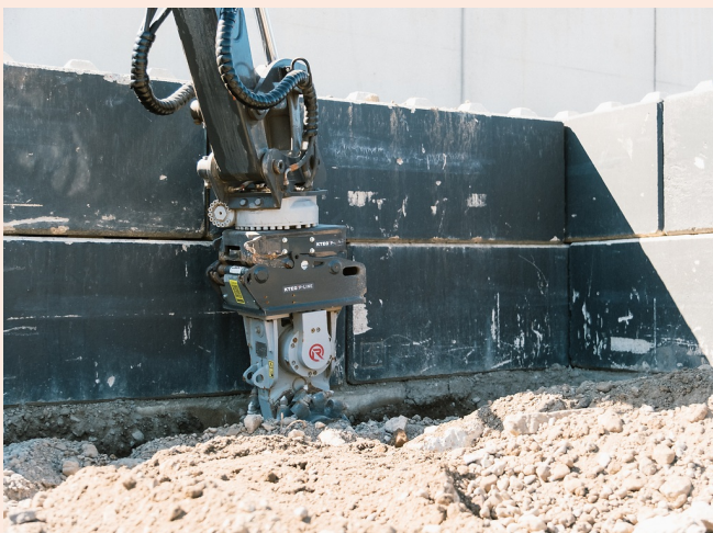
Kontrolliertes Fräsen in direkter Wandnähe