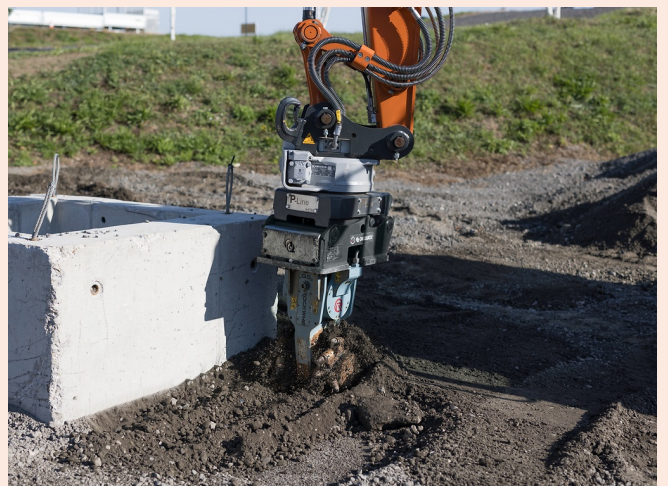
Exakter Fräseinsatz an Kanten und Übergängen