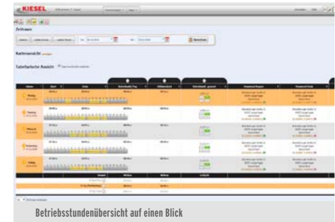
Betriebsstundenübersicht auf einen Blick