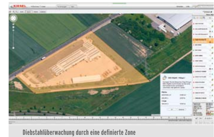
Diebstahlüberwachung durch eine definierte Zone