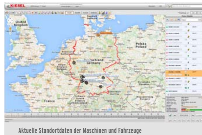
Aktuelle Standortdaten der Maschinen und Fahrzeuge