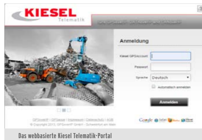
Das webbasierte Kiesel Telematik-Portal