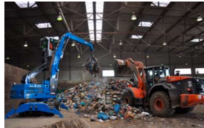
Maschinen unterschiedlichster Hersteller in einer Anwendung